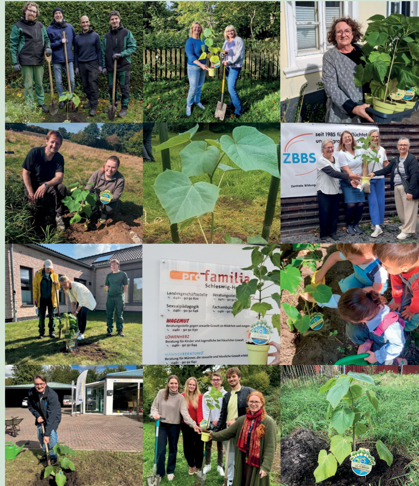
150 Bäume für 1,5 Grad – im letzten Jahr pflanzten unsere Mitgliedsorganisationen fleißig Klimabäume.