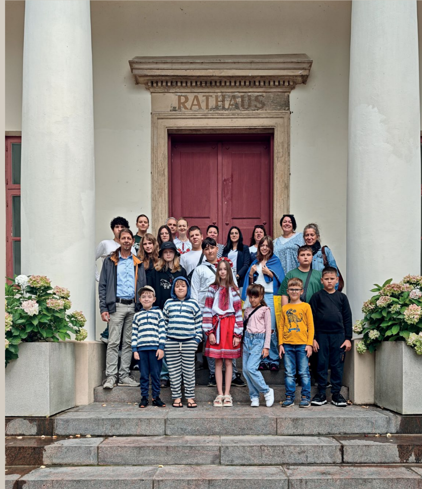
15 Kinder aus Irpin waren zur Erholung in Neustadt – organisiert unter anderem von Kinderschutzbund Ostholstein und Rozmova e.V.